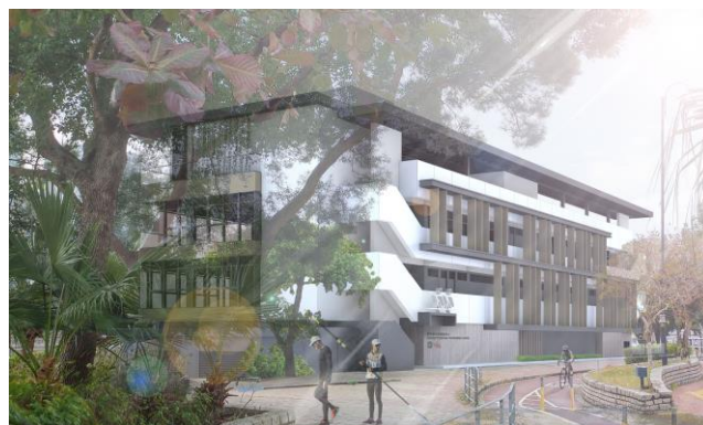
沙田賽艇中心外觀