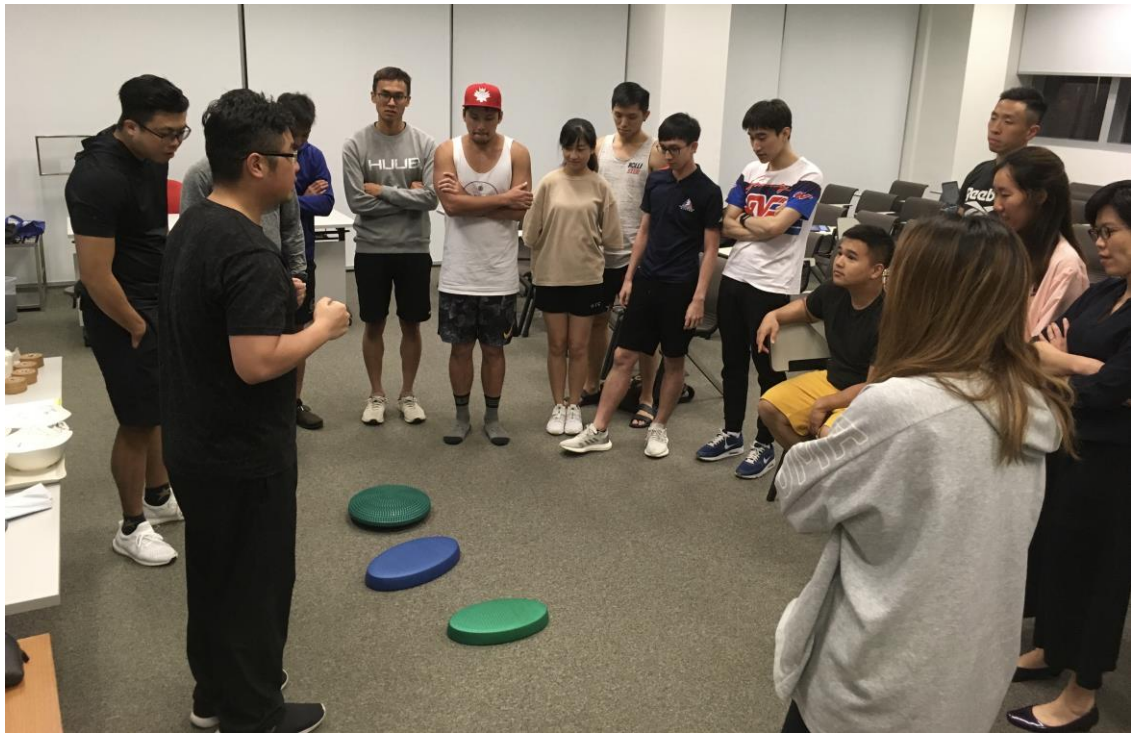
處理運動創傷的課堂